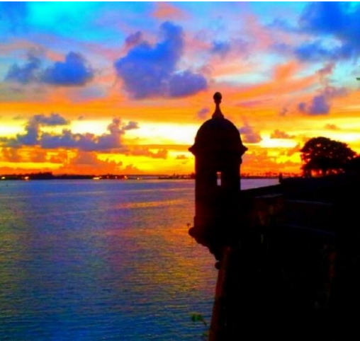
El Morro de Puerto Rico.