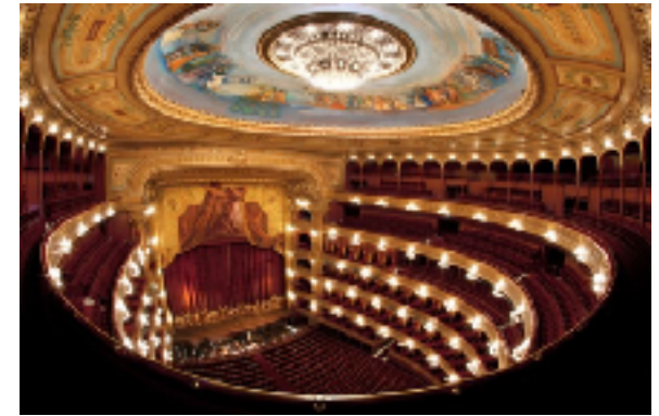
El Teatro Colón