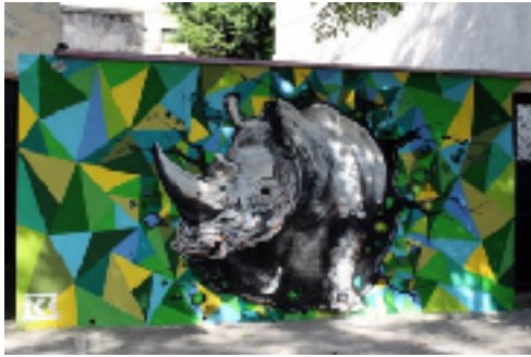
Unnamed por Ice